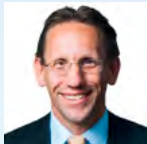
Dr. Jörg Kukies Bundesministerium der Finanzen